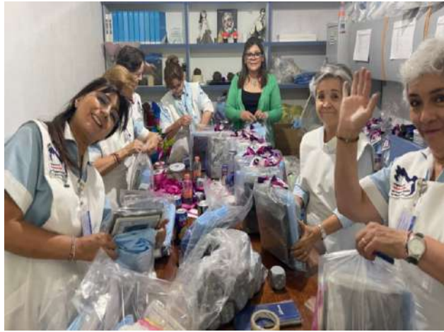
Día de las Madres